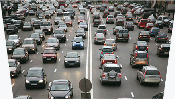
Mit Up View-Funktion

Die EIZO Up View-Funktion sorgt dafür, dass die Farben nicht ausgewaschen wirken, wenn Sie zu dem Bildschirm aufblicken müssen. Dies ist von Vorteil, wenn der Monitor beispielsweise an einer Wand oder der Decke befestigt ist.