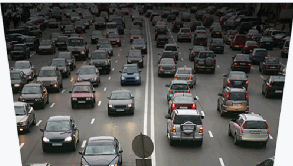
Ohne Up View-Funktion